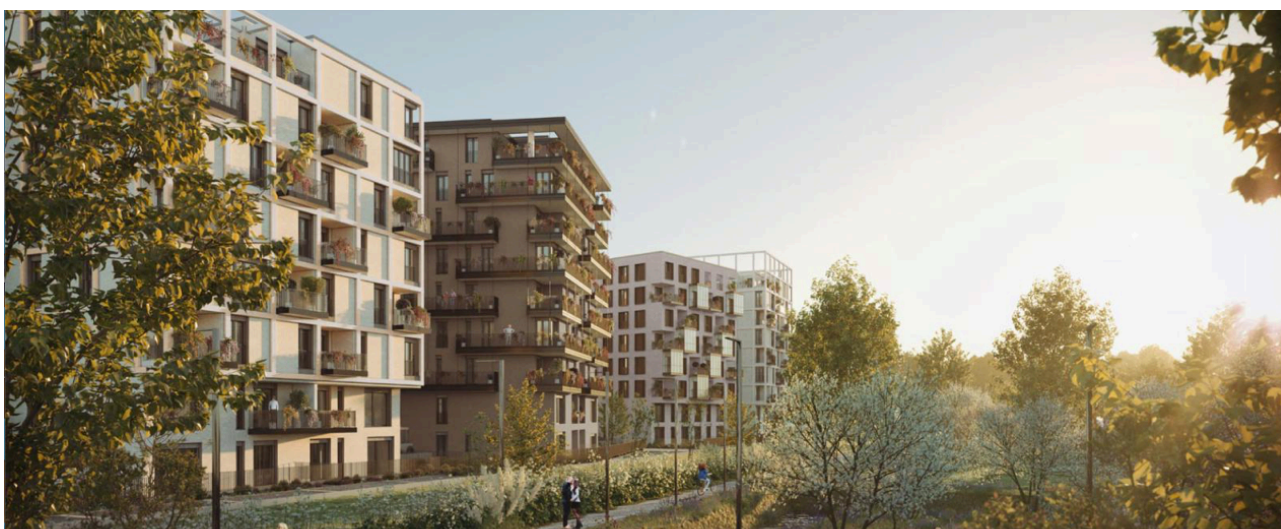
Rendering del piano di rigenerazione urbana SeiMilano (credito: Mario Cucinella Architects)

Il piano di rigenerazione urbana a Sud Ovest della città meneghina porta la firma del fondo globale statunitense in collaborazione con la società di sviluppo immobiliare Borio Mangiarotti